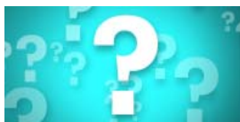
Foire aux questions (FAQ)

Sur notre site web ( www.amb-canada.fr/eic ), recherchez les icônes ci-dessous pour accéder à des explications supplémentaires ou pour obtenir davantage de renseignements vous permettant de mieux préparer votre séjour.